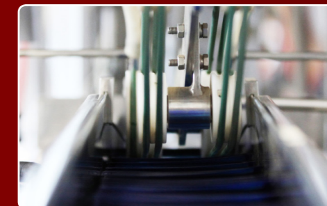
... Mittenantrieb und Gurt-Schnellwechselsystem