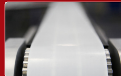
... verstellbarer Gesamtlänge