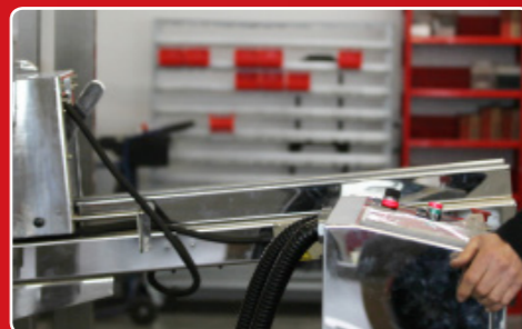
... ausziehbarem Arbeitstisch