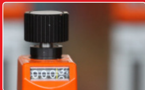
... so-maX Höhenverstellung